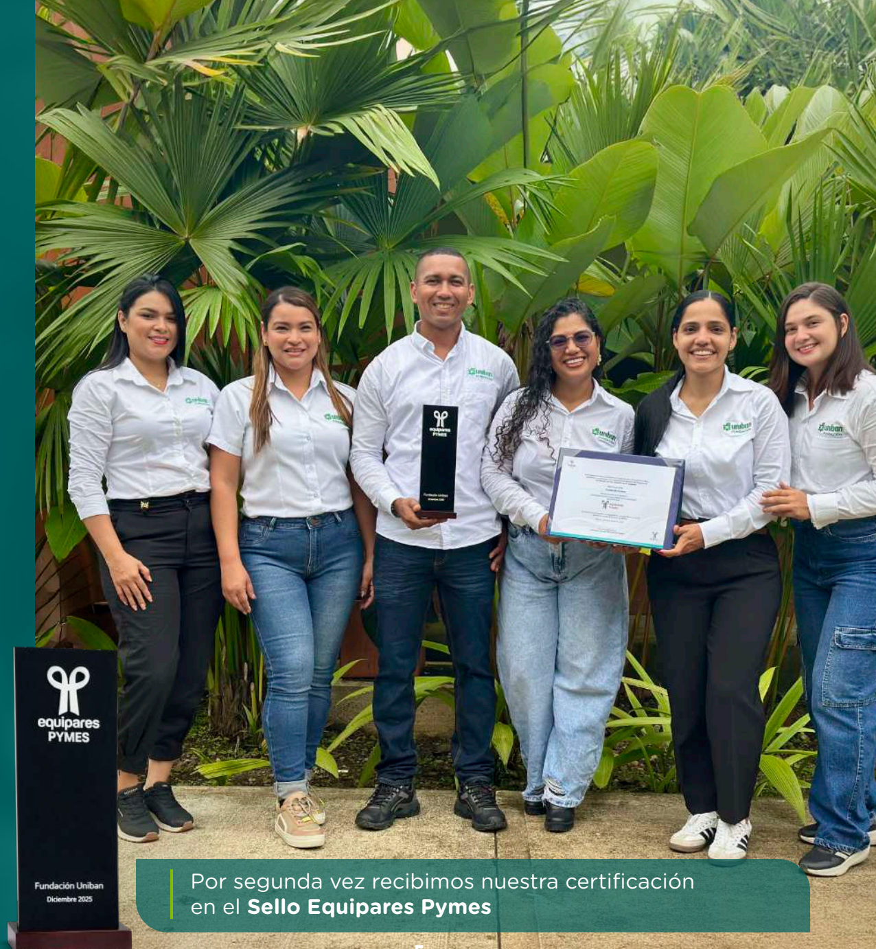
Por segunda vez recibimos nuestra certificación en el Sello Equipares Pymes

En el año 2025 se suscribieron 184 contratos, de los cuales el 14% corresponde a iniciativas de cooperación. De este grupo, el 86% se ejecutó en la región de Urabá, mientras que el porcentaje restante se desarrolló en el departamento de Magdalena.